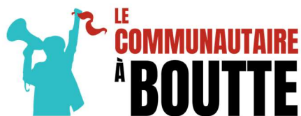
IMAGE DE MARQUE Mouvement de grève communautaire

L'image de marque du mouvement « Le communautaire à boutte! » se construit autour d'un univers visuel, symbolique et narratif fort qui traduit à la fois la colère, la fatigue et la fierté du milieu communautaire.